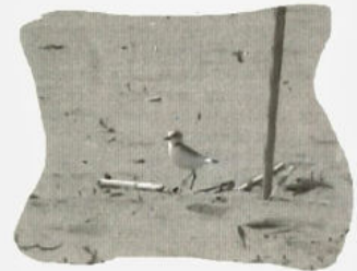
Il Fratino sta entrando nel nido dove ha depositato due uova

ENTE-PARCO REGIONALE MIGLIARINO-SAN ROSSORE-MASSACIUCCOLI