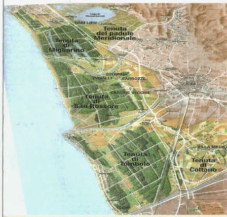
Cartina: alla scoperta del parco, un'area verde a cielo aperto, Parco Migliarino S. Rossore Massaciucoli